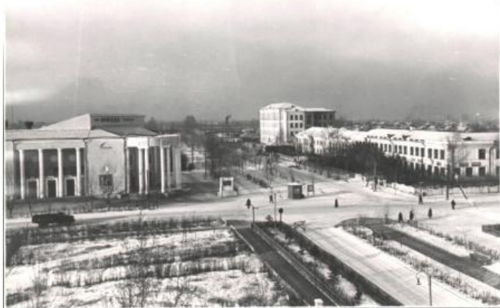
Абаканский государственный учительский институт, 1950 г.