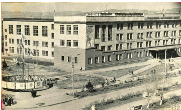
Описание: Ф-2-013. Обл. 1. Д. 91

В 1944 г. руководство Хакасии обратилось в Красноярский край и в Москву с просьбой открыть педагогический институт. 10 февраля 1944 г. Совет Народных Комиссаров РСФСР принял постановление об организации Абаканского государственного педагогического института с факультетами русского языка и литературы, исторического, физико-математического.